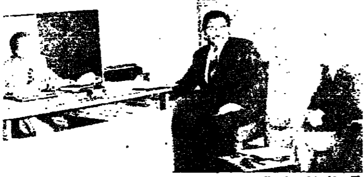
الحافظ يعالج الوضع مع موفقي الاقتصاد

طرابلس - من كمال حيدر قد تكون المسبة الأولى - والأهم - التي تركت طابعها على الاستهلاك الغذائي هي دوامة ارتفاع الأسعار خلال هذه السنة، هي ارتفاع أسعار اللحوم، وانقضاء أبعادها كخطراً يهدد بأمم الجوانب الغذائية للمواطن اللبناني، وصار لازماً على رب العائلة ذي الدخل المحدود، ان يعد للضرورة، فإن ان ينكر بتناول اللحوم طوال هذه الفترة التي ارتفعت فيها الأسعار، وربما نظروا الى ان يجد القاشور على هذا القطاع الاقتصادي والغذائي الهام الرسائل الكفيلة بحق جماع احتسار الجوارح والمواشي وزيادة الاسعار.